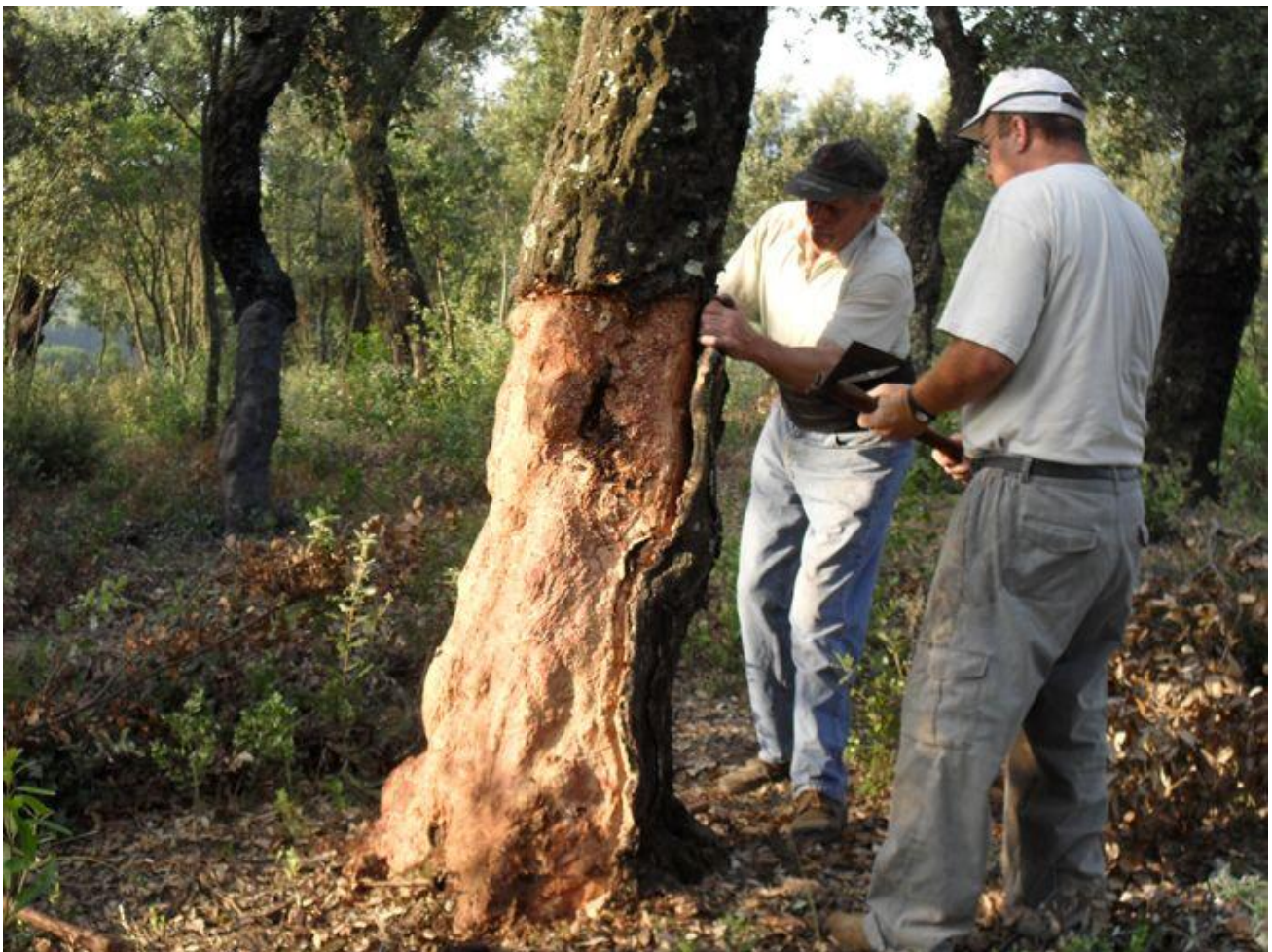
Peladors de suro

En els darrers anys, aquest inventari ha tingut continuïtat a través de diferents treballs de recerca, com l'estudi sobre els usos tradicionals de l'aigua al Montseny o sobre el mas al Montseny.