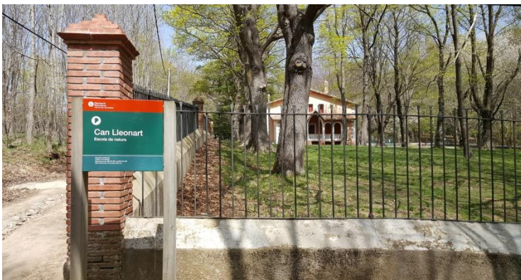
Escola Natura Can Lleonart