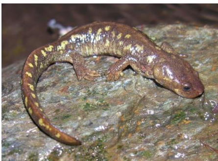
Tritó del Montseny

Des de la Reserva de la Biosfera del Montseny, la gestió de l'aigua s'ha treballat a través del projecte BeWater. Aquest projecte europeu té per objectiu assolir una gestió de l'aigua sostenible i l'adaptació als impactes de canvi global. Totes les accions que es derivin d'aquest pla tindran vital importància en les accions d'adaptació al canvi climàtic. Actualment, s'està treballant en la millora dels hàbitats aquàtics, a través del projecte europeu Life Tritó Montseny