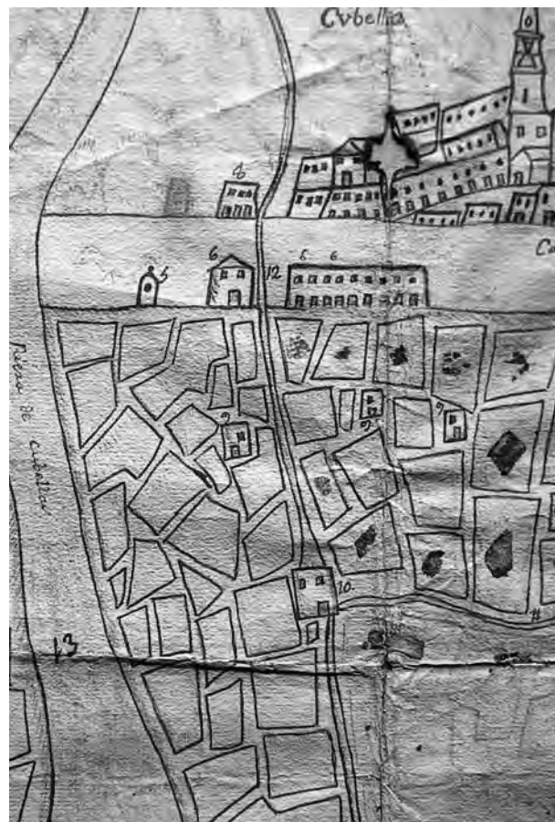
Figura 4. Detall del plànol amb els elements 5 (pou), 6 i 8 (cases), 9 (pallisses), 10 (molí de Sant Pere), 11 (camí que va a Vilanova des del molí), 12 (rec del molí) i 13 (riu Foix).