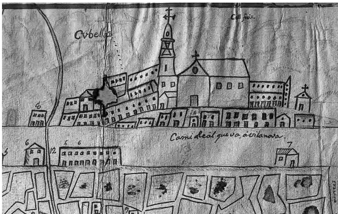
Figura 2. Detall del poble de Cubelles i del camí ral, amb els elements 6 i 8 (cases), 7 (hostal) i 12 (rec del molí de Sant Pere).

També rep el nom de Molí de Baix. El camí que des de Cubelles anava fins al molí de Sant Pere era també el que «va a la mar», segons consta en documentació del segle XVI en endavant (Avinyó, 1993, 68) i coincidiria amb l'actual carrer de l'Estació. El molí estaria situat vora la cruïlla de l'avinguda de l'Estació i el carrer de Josep Andreu Charlie Rivel. La recent urbanització de la zona el va destruir, però sembla que encara se'n conservaven restes el 1968; la seva bassa estaria al costat de la cruïlla dels carrers de l'Estació i del Poeta Cabanyes (Palau, 1989, 277). Al terme de Cubelles hi havia altres molins fariners riu amunt, com els d'en Cucurella, del Salze, el Nou, de l'Estaper i la Palma (Miret, 1990). Al final del segle XVI s'establiren acords entre moliners i pagesos per tal d'aprofitar les aigües sobreres dels molins de la zona de Rocacrespa per regar horts (Avinyó, 1993, 66).